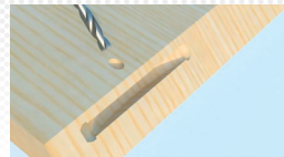
Nur ein Werkzeugwechsel