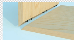
Vielseitig für alle Winkel und Verbindungssituationen