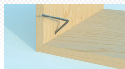
Kraftvoll und wiederlösbar verbunden