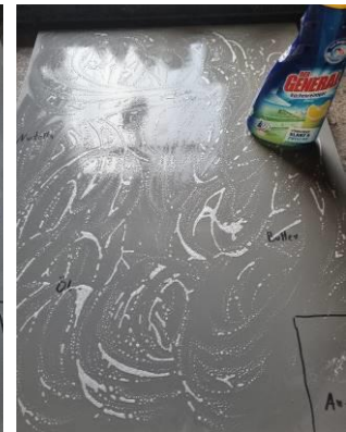
4. Reiniger flächig auftragen