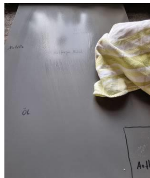
6. Front mit Baumwolltuch gleichmäßig trockenreiben