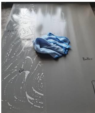
5. Reinigungsrückstände nach Wirkzeit mit heißem Wasser und Microfasertuch abnehmen