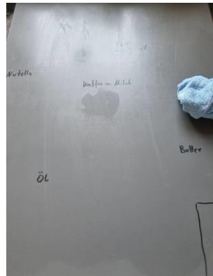
2. Feucht abwischen