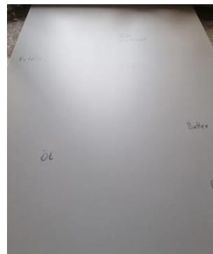
7. Streifen- und schlierenfreies Ergebnis